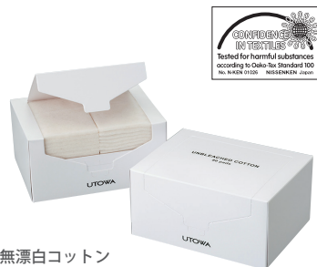
無漂白コットン サイズ:60×80mm 80枚入り ¥660(税込) 無漂白で環境にやさしい柔らかな 感触の高品質の大判コットン。 「エコテックス規格100」認定製品。