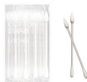
綿棒 40本入り ¥440(税込)